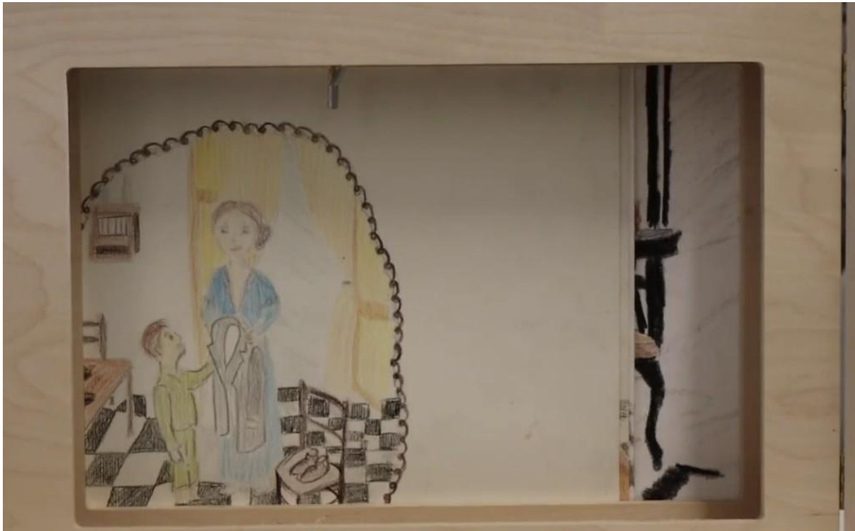
Tavola 3: Il viaggio verso l'ignoto

Testo: Amerigo sale sul treno. È un viaggio lungo, pieno di pianti e sguardi smarriti fuori dai finestrini. Mentre il paesaggio cambia, Amerigo si sente come un pacco spedito verso l'ignoto. Ma non è solo Amerigo che prova di saggio. Ci sono centinaia di bambini che, come lui, lasciano il vicolo per la prima volta diretti verso una meta che non riescono nemmeno a immaginare.