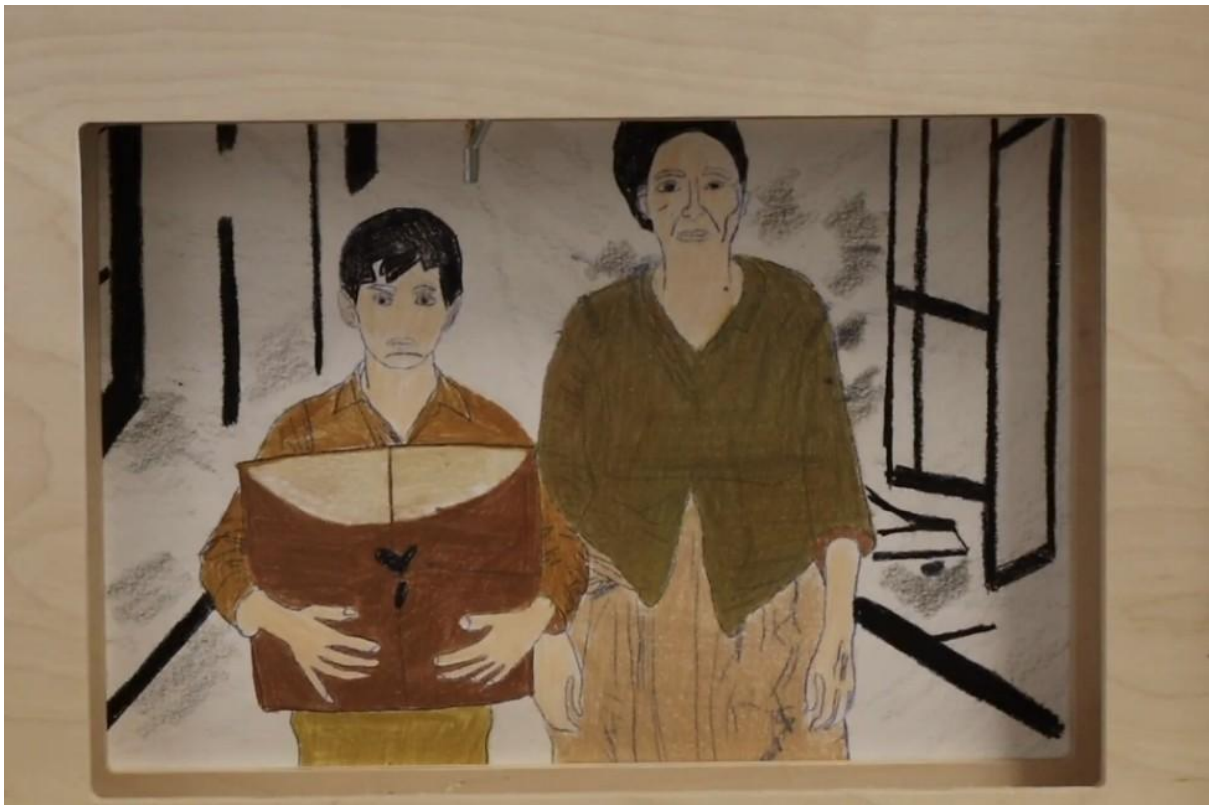
Tavola 7: Il ritorno amaro

Testo: Viene il giorno del ritorno e Amerigo rientra a Napoli carico di regali e di speranze, ma l'impatto è brutale. Il vicolo è rimasto sporco, povero e stretto.