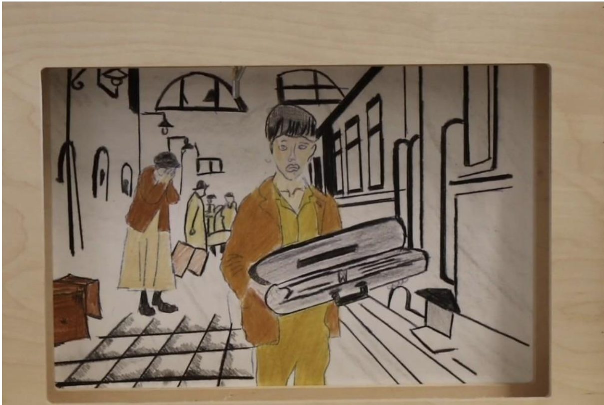
Tavola 9: La fuga

Testo: Senza dire nulla, Amerigo scappa, corre alla stazione e sale su un treno diretto a nord, verso la sua famiglia scelta. È un addio straziante perché è silenzioso. Amerigo decide di dimenticare il suo passato, cambia cognome e diventa un'altra persona.