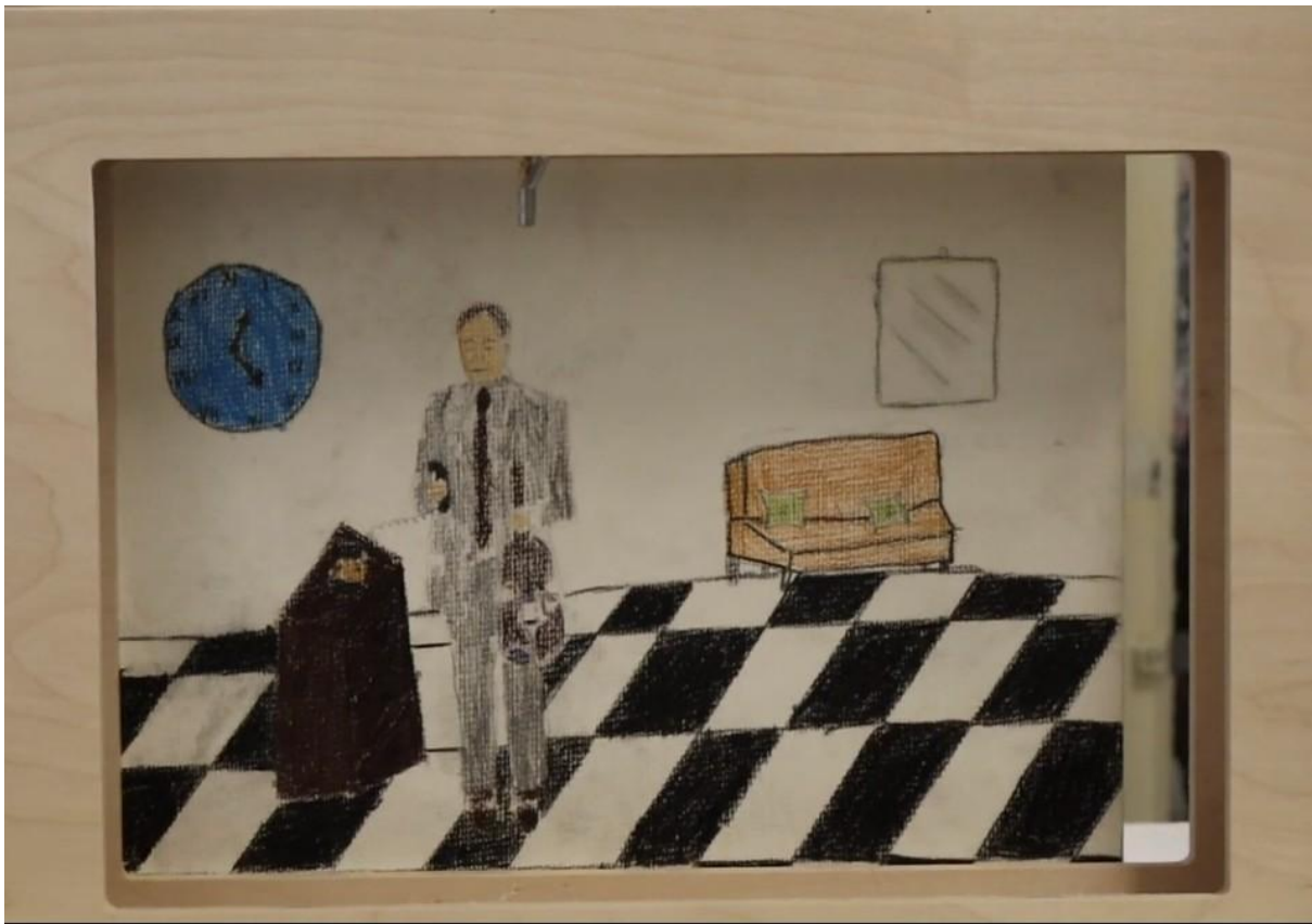
Tavola 10: Cinquant'anni dopo

Testo: Cinquant'anni dopo arriva quel momento che non avrebbe mai voluto che arrivasse, la notizia della morte della madre. Tra quelle strade che aveva giurato di dimenticare ritrova i vecchi compagni e i luoghi della sua infanzia.